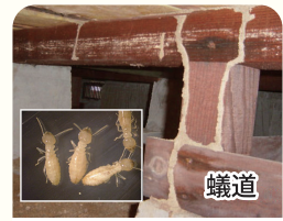
シロアリによる被害